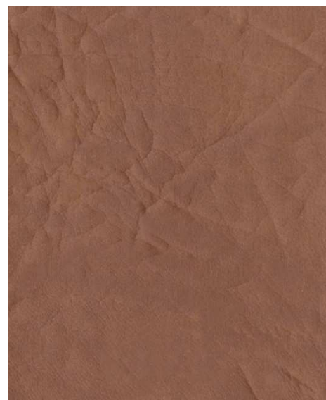
4255 - hnědá