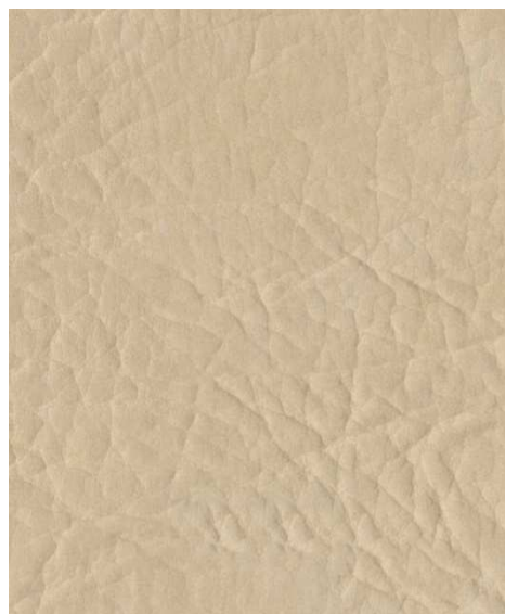
811 - béžová