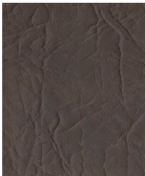
4985 - čoko