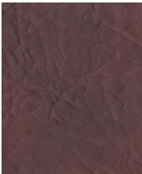
2592 - bordó