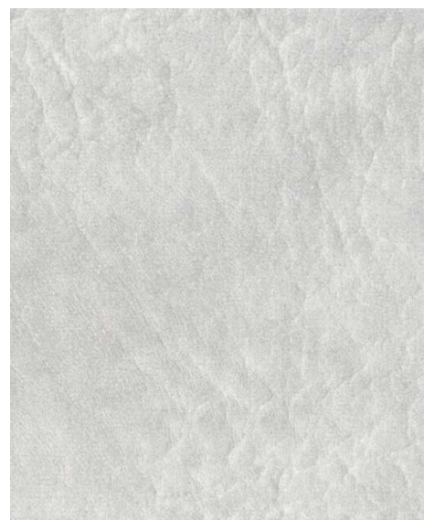
805 - světle šedá